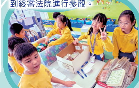
四年級學生進行服務學習，進行義賣活動。