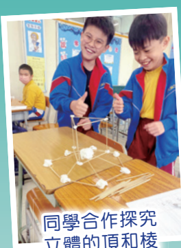
同學合作探究立體的頂和棱