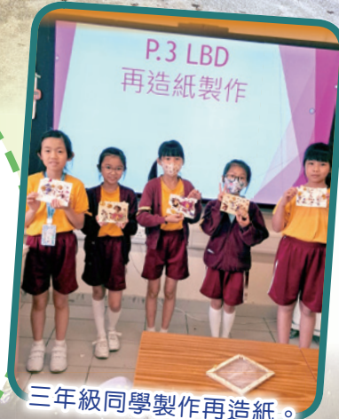
三年級同學製作再造紙。