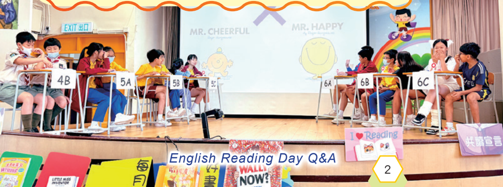
English Reading Day Q&A