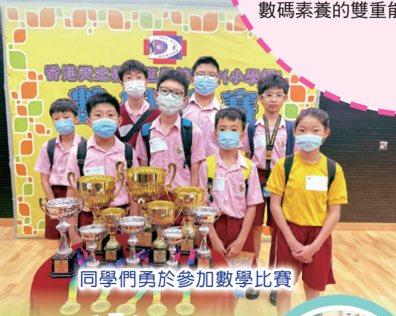
同學們勇於參加數學比賽