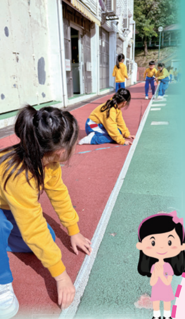
同學探究1公里有多長