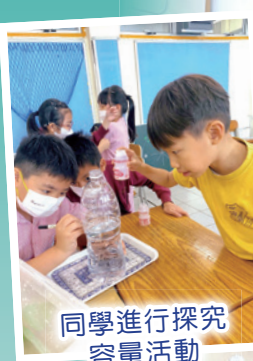
同學進行探究容量活動