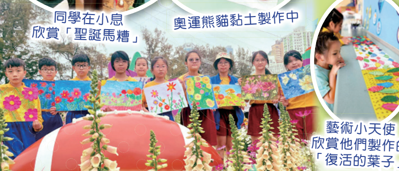
參加維園花卉繪畫比賽