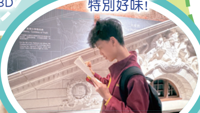
六年級全方位學習活動，到終審法院進行參觀。