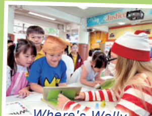
Where's Wally Game Booth

We also invited assistant librarians from Tsing Yi Public Library to help enhance students' awareness of World Reading Day, too!