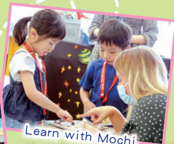
Learn with Mochi