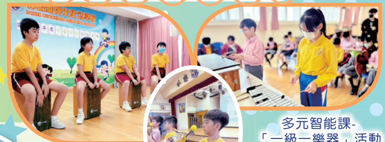
才藝繽紛Show--木箱鼓表演