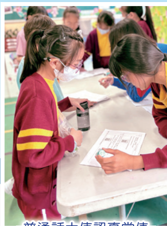
普通話大使認真當值