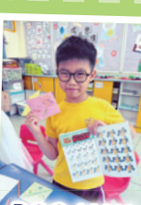
DOG MAN Corner Bookmark