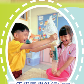
二年級同學進行LBD模擬消化系統。

本校常識科課程精彩豐富，小一至小三推行LBD「感·創·做」計劃，讓學生親身探索，動手體驗，結合多元化的學習活動，包括服務學習活動-怡雅市集、全方位活動日、多元智能課、課外活動-科學小偵探及講座等活動，讓學生在趣味中學習，培養創意思維與科學精神！