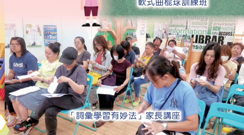
「詞彙學習有妙法」家長講座