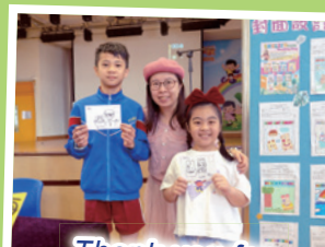
Thank you for the sketch!