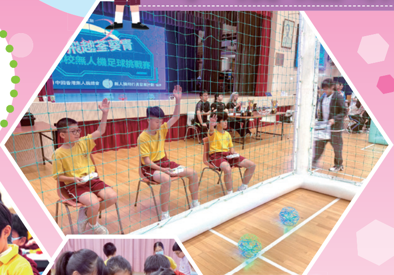
學界無人機足球比賽榮獲亞軍

本年度同學們參加了各項STEAM活動和比賽，在無人機比賽、機械人編程比賽、定格動畫比賽等取得多個獎項。學校亦組織了不同的STEAM課程活動，讓同學有豐富的學習體驗。跨學科學習活動STREAM Week裏，同學透過動手做，利用編程知識製作出各種創科作品。