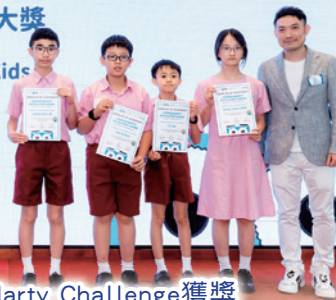
第二屆Global Marty Challenge獲獎