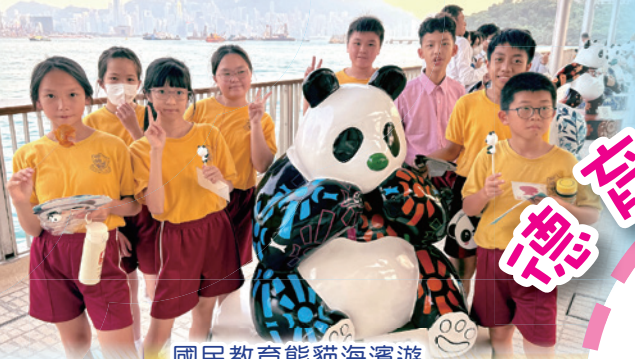
國民教育熊貓海濱遊