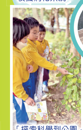
「探索科學到公園」考察活動，考察公園環境，探索與科學有關的事物，感受大自然的奧秘。