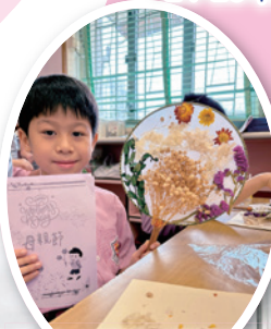
看！我親手做了禮物送給媽媽了。