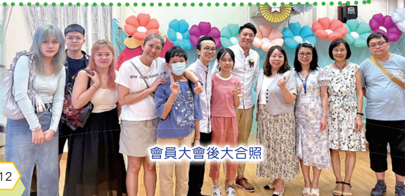
會員大會後大合照