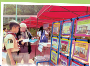
Harry Potter Game Booth