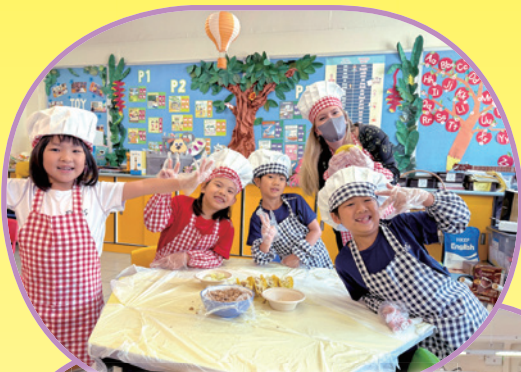
We are Little Master Chefs!

We actively provide a wide range of engaging English activities for our students throughout the year, empowering them to communicate confidently in English. The following are some of them: