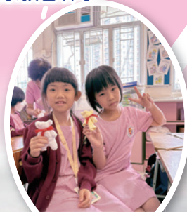
我摺了毛巾熊送爸爸。