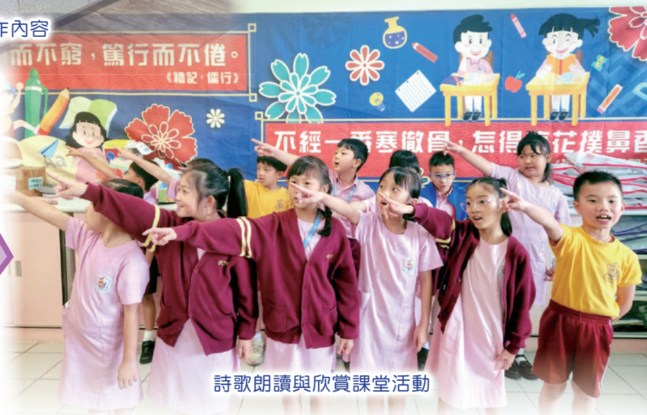
詩歌朗讀與欣賞課堂活動