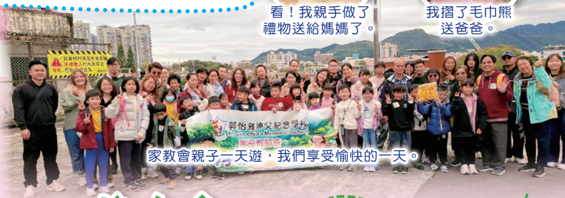
家教會親子一天遊，我們享受愉快的一天。