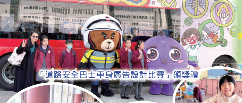
「道路安全巴士車身廣告設計比賽」頒獎禮