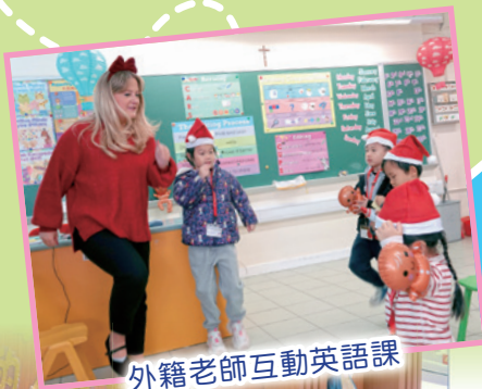
外籍老師互動英語課

本校舉辦「怡雅多元智能學習日」系列，讓幼稚園生體驗STEAM課程。並與幼稚園合辦體驗課、親子工作坊、家長講座及校園導賞，促進互動與交流。