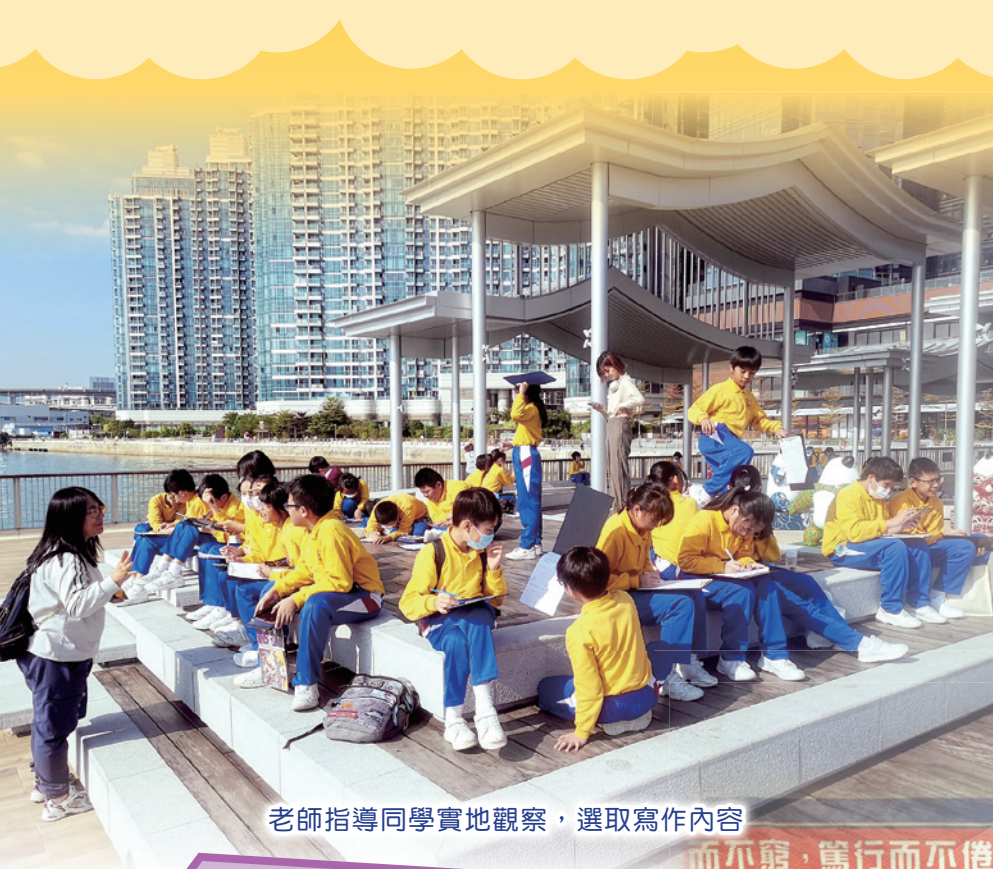
老師指導同學實地觀察，選取寫作內容

活動方面，學生於一月參與「中華文化日」，當天活動以熊貓為主題、另有攤位遊戲、舞獅表演、中華文化專題介紹等，讓學生在不同的學習經歷中，加深對中國文化的認識，體驗節日的歡樂氣氛。此外，學生亦參與了校際朗誦比賽、書法比賽及作文比賽等。