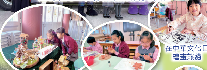
奧運熊貓黏土製作中