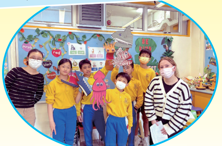
Story to Stage Puppetry Competition

This year, students perform a puppetry show based on the core value, 'Perseverance'. Students edited the script, learnt their lines as well as designed their puppets and sets. The competition enhances students' speaking skills by encouraging them to experiment with language through puppetry!