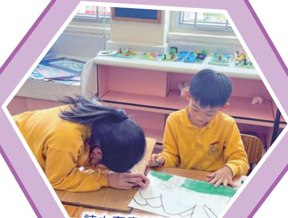
詩中有畫創作活動