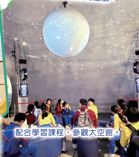
配合學習課程，參觀太空館。