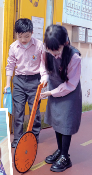
同學用滾輪進行量度活動