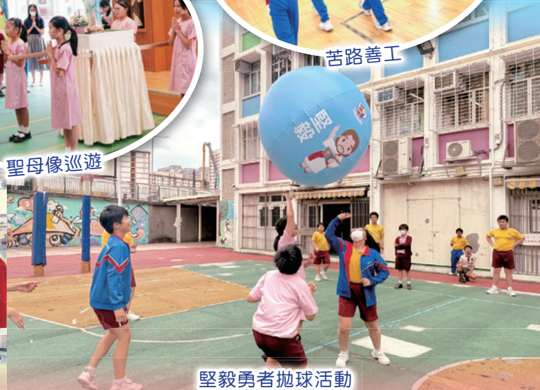
堅毅勇者拋球活動