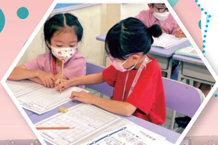
大手牽小手伴讀計劃