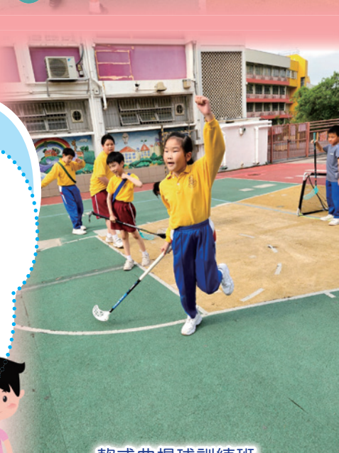
軟式曲棍球訓練班