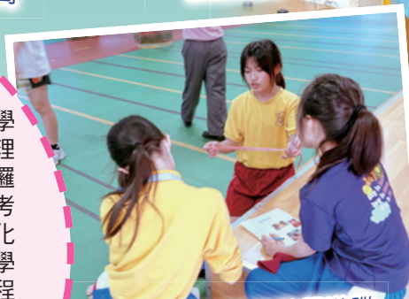
同學們合作地進行數學遊蹤