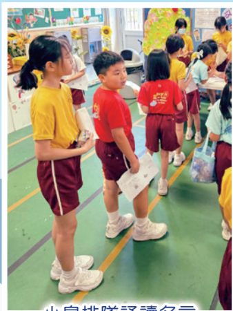
小息排隊誦讀名言

本科以培養學生聽、說普通話能力為主，積極營造語境氛圍。課堂上為學生創設不同情境，增強互動性，促進學習動機。在每個循環周的普通話日，當天集隊、宣佈、祈禱等均以普通話進行。與德公科跨科合作齊誦中華經典名句活動，安排普通話大使分享名人名言，組織學生於課間誦讀，增強對中華文化的認識。科任老師積極鼓勵、訓練學生參加比賽，如校際朗誦比賽、普通話水平考證、普通話演講比賽等，讓學生能充分發揮潛能，獲取多元學習經驗。