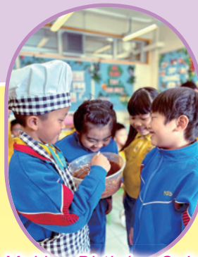
Making Birthday Cake