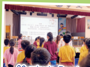
30-minute Read Session