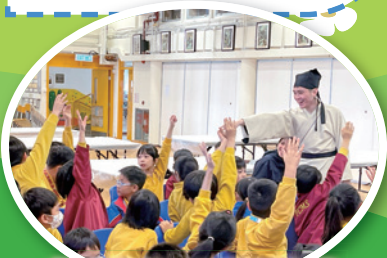
法律故事：正義村劇場