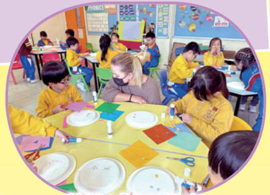
Making Paper Masks