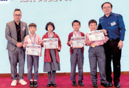
第四屆定格動畫比賽獲獎