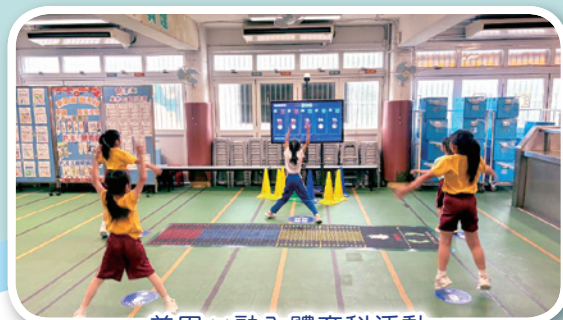
善用AI融入體育科活動

在學生表現方面，電腦科老師訓練學生代表參加由香港科技創新促進組（HKtag）、數字政策辦公室及香港數碼港管理有限公司合辦「開放數據應用比賽2024」，參賽學生榮獲一等獎及最佳創新獎，獲獎學生更獲邀於香港國際創科展上向公眾展示獲獎作品。在其他科技比賽方面，本校學生屢獲獎項，包括聯校無人機足球挑戰賽、全球機械人挑戰賽、全港定格動畫創作比賽等，老師把握機會讓學生發揮其無限的創意思維，運用科技展示學習潛能。