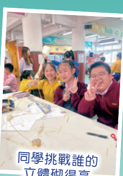
同學挑戰誰的立體砌得高