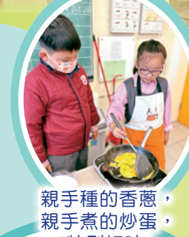
親手種的香蔥，親手煮的炒蛋，特別好味！