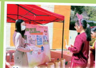
Knowing more about Tsing Yi Public Library