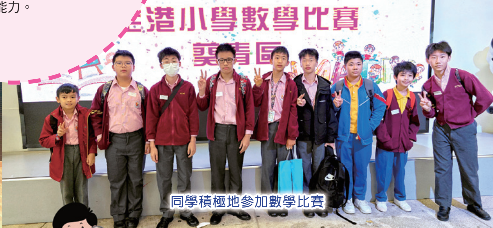
同學積極地參加數學比賽