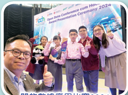
開放數據應用比賽2024

作為一所天主教小學，我們深信教育不只是傳授知識，更是滋養靈魂、塑造品格的地方，所以我們致力實踐「全人教育」的理念，讓學生在學術與品德上並肩成長。