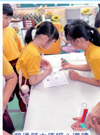
普通話大使細心導讀