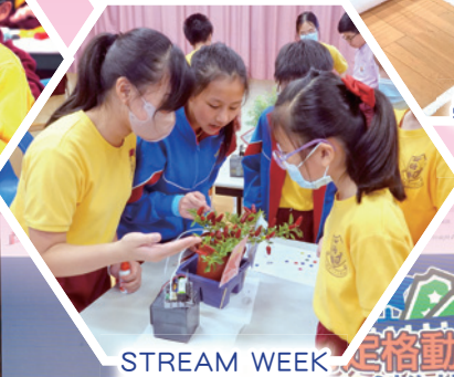
STREAM WEEK 定格動畫 跨學科學習活動 創作比賽