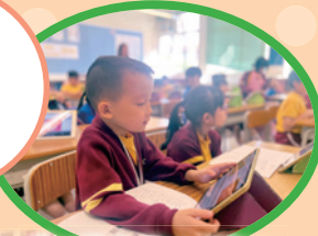
English Fun Time